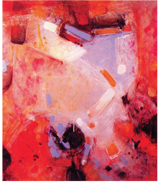
تجريدية غنائية: تجربة حياة

لكن حرب تموز ٢٠٠٦ أعادته إلى قلقه وتمزقه فاقام معرضه الأخير تحت عنوان: حزن، دهشة، فرح عام ٢٠٠٩ بأعمال كبيرة وعملاقة يصف فيها علاقته الوجدانية بالحدث الهائل الذي اصاب شعبه ومنطقته وذاته، متبصراً بالإرتدادات العنيفة التي تركها هذا الحدث على وطنه وشعبه وذاته.