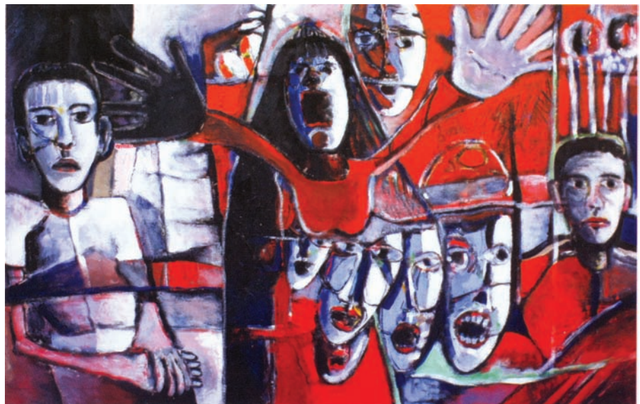
صرخة من اوجاع حرب ٢٠٠٦

شجعت باريس الفنان على الانخراط في التجربة العالمية فكان له معرضين سنة ١٩٨٨ وسنة ١٩٩٠ في مركز استقبال طلبة الشرق الأوسط والجامعة العربية. شجعت تجربته الحروفية على الانحياز نحو التجريد الغنائي العاطفي، استعمل الفنان