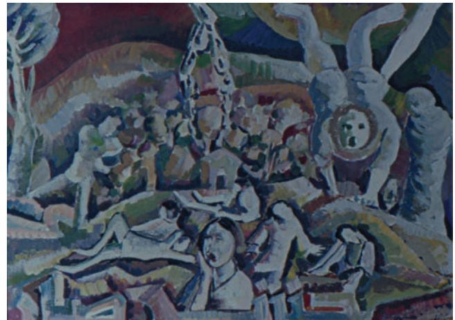
كتل وطبيعة ولغة: مفردات الحرب الأهلية