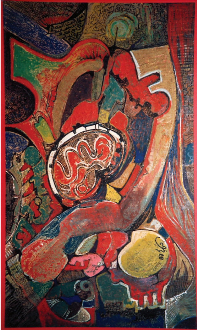
تقاطع من وحي التراث

وفي سياق همّه التفتيشي الدائم عن الهوية، انسحبت تعبيرات الفنان نحو استلهامات تأخذ من الخط العربي سياقات وعلائق بشرية أو شبه تجريدية، كأنه بذلك يرجع الخط إلى أصوله الصورية أي أنه أدخل في تجريدياته الحروفية الألم الكامن والمتعايش في عمقه من دون كلل.